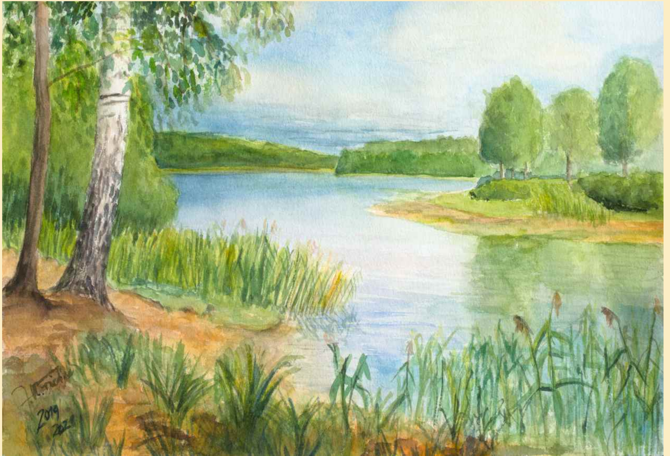
die Sonne scheint wieder am Clanssee