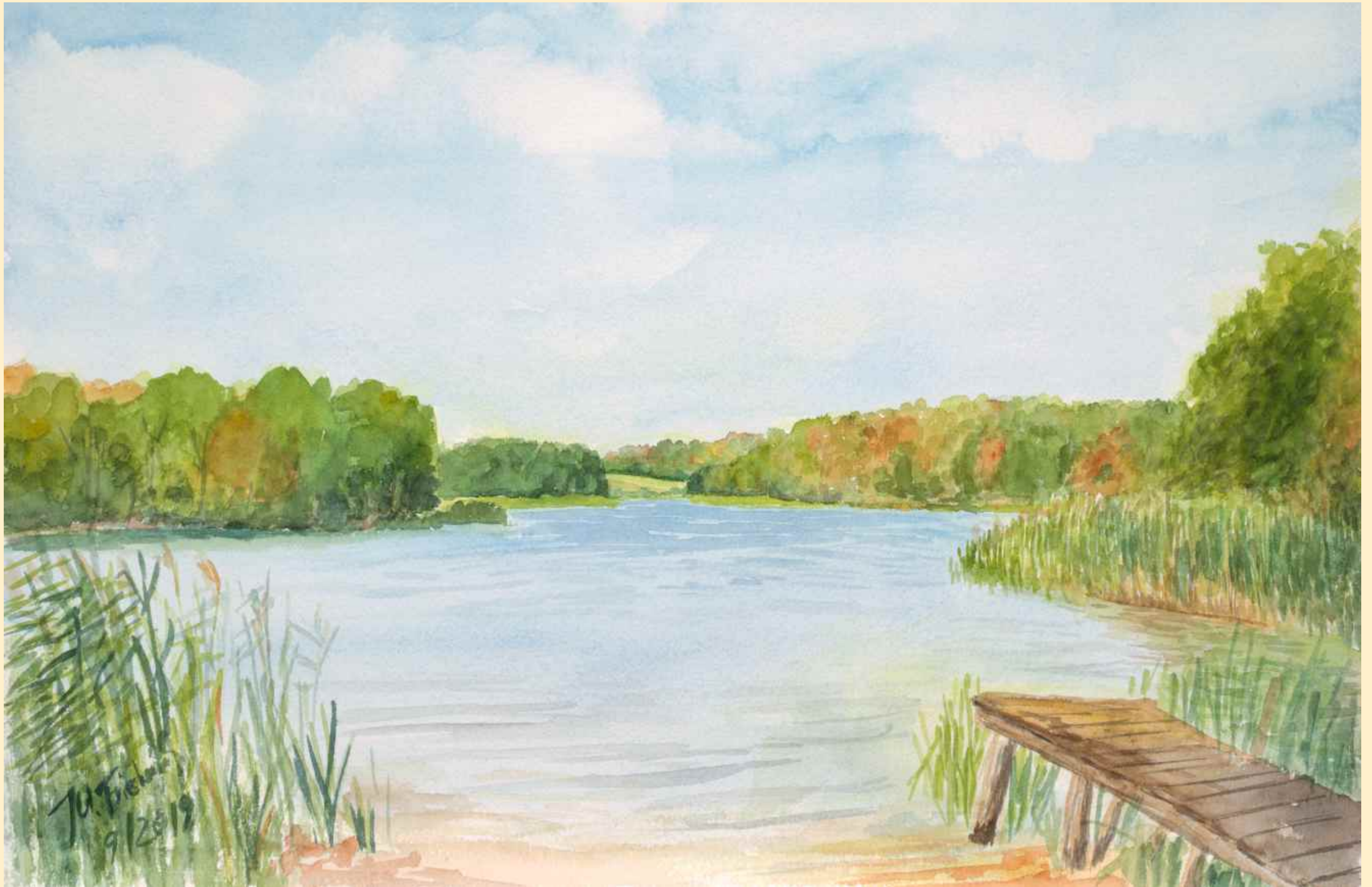
ein windschiefer Steg am Mellensee, klares Wasser und die Landschaft ist ein Genuss