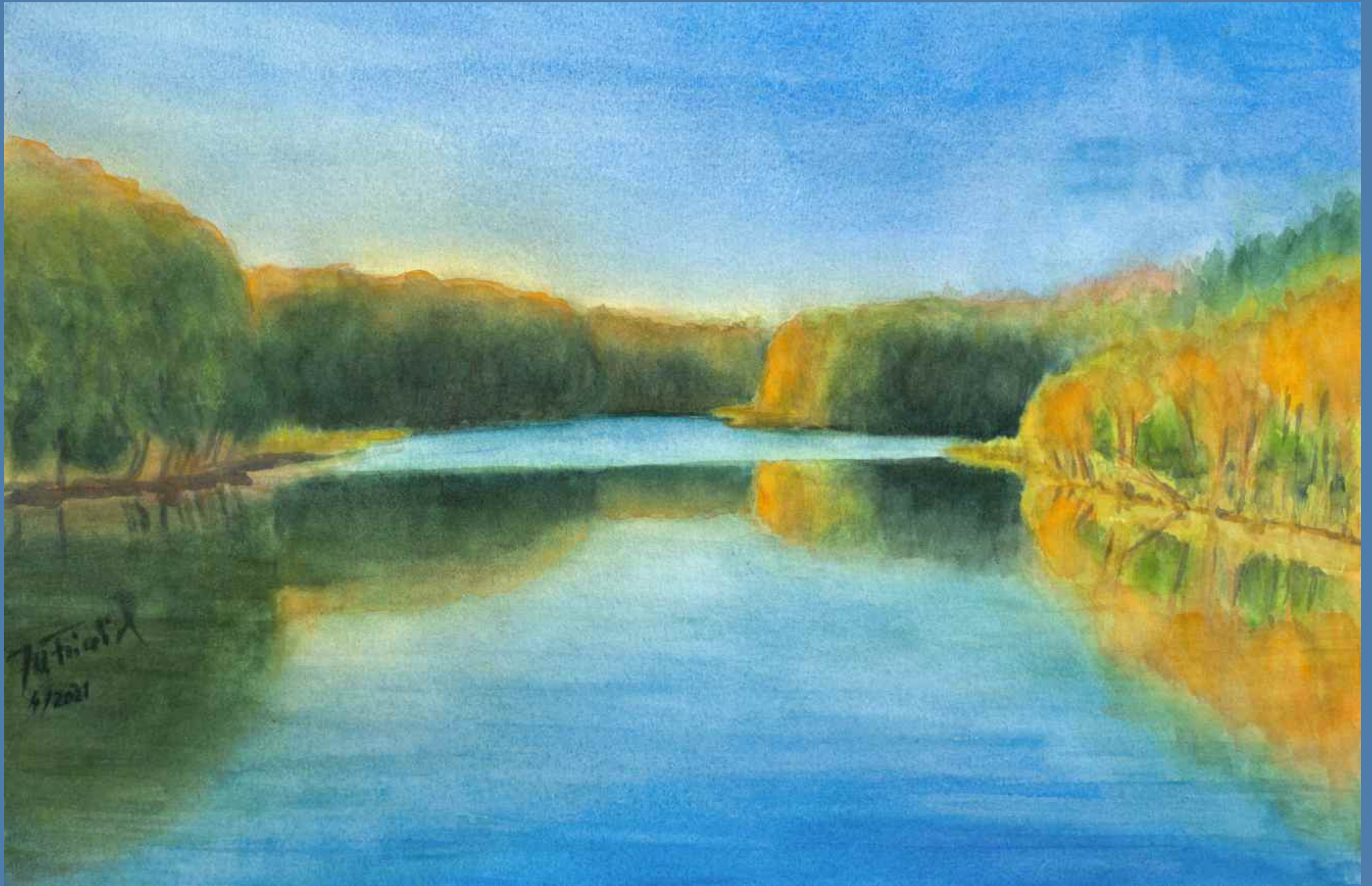
recht erhaben ist der Blick auf den Großen Suckowsee