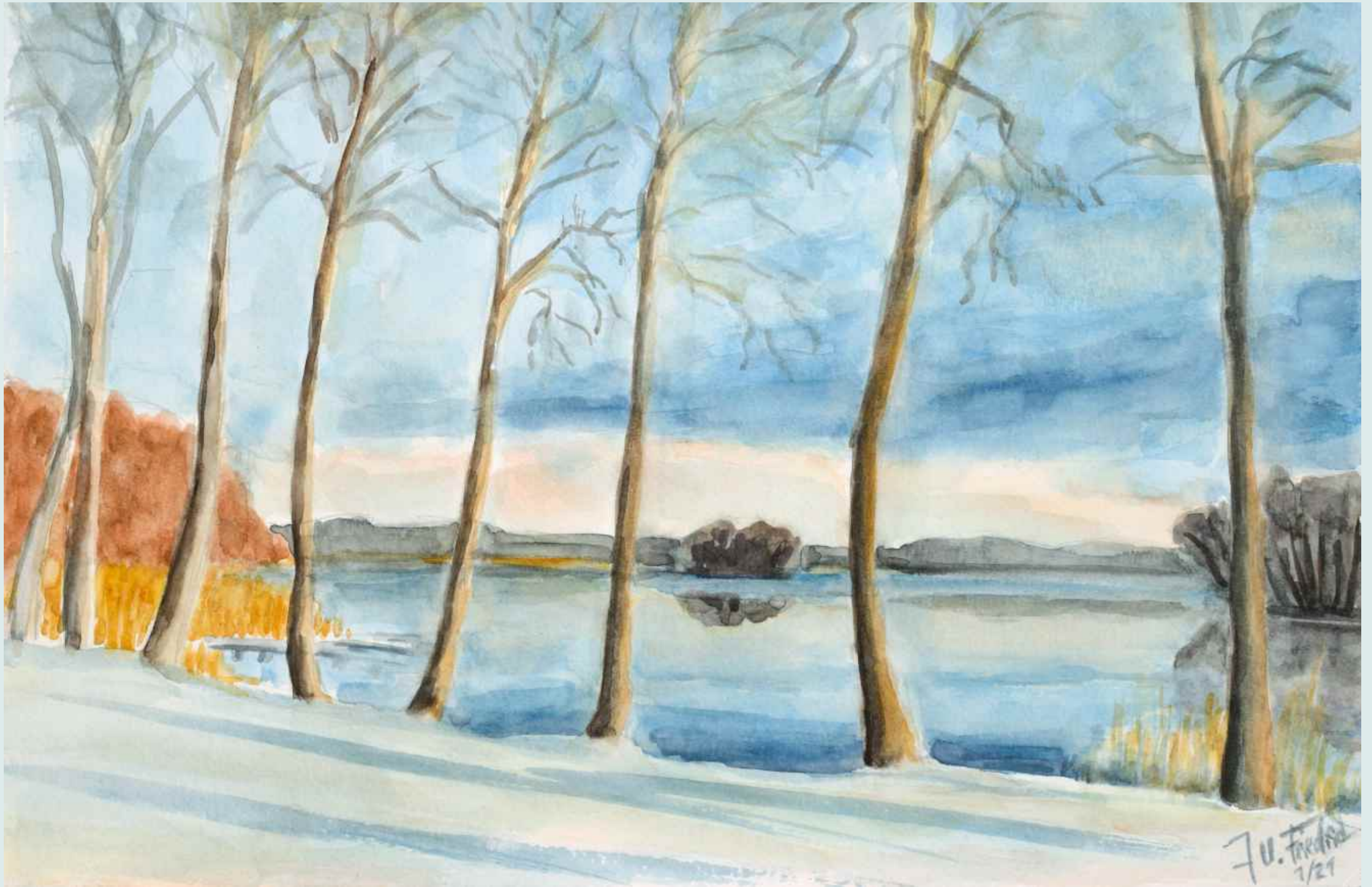
Winterstille am Templiner Stadtsee

| 1 2 3 4 5 6 7 8 9 10 11 12 13 14 15 16 17 18 19 20 21 22 23 24 25 26 27 28 29 30 31