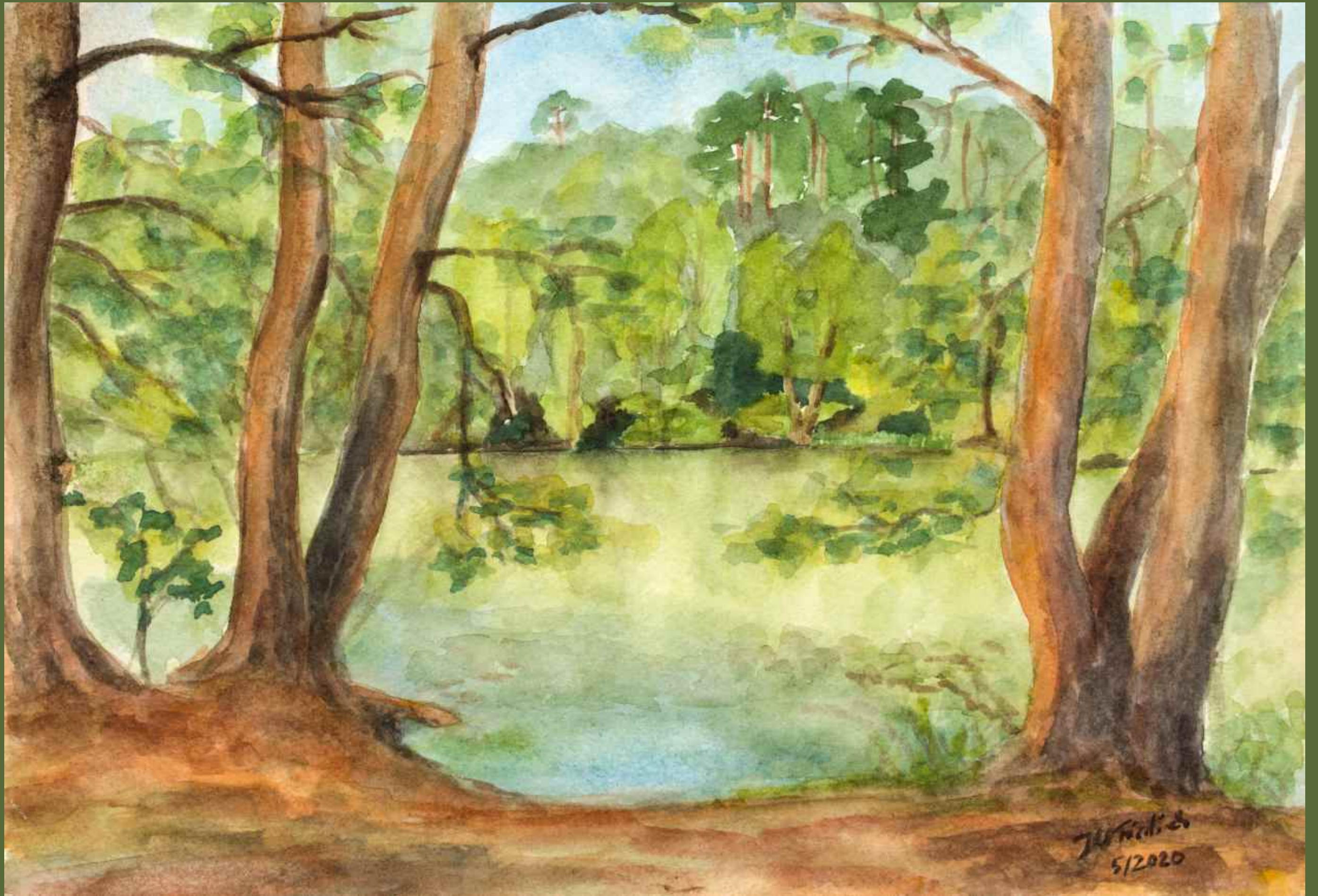
zum Platkowsee kommt man nach einer schönen Wanderung durch einen herrlichen Wald