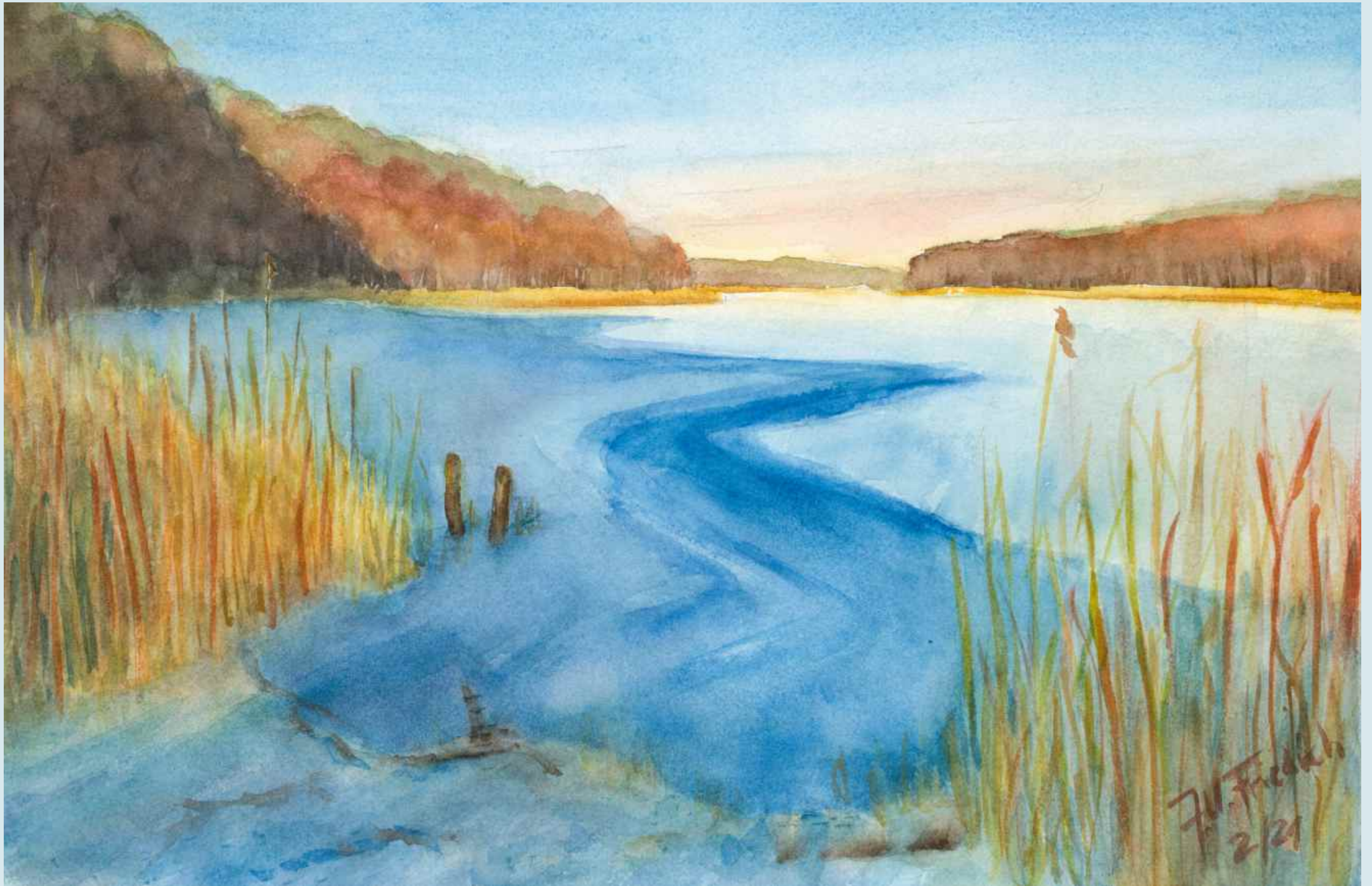
Eiseskälte am Großen Gollinsee