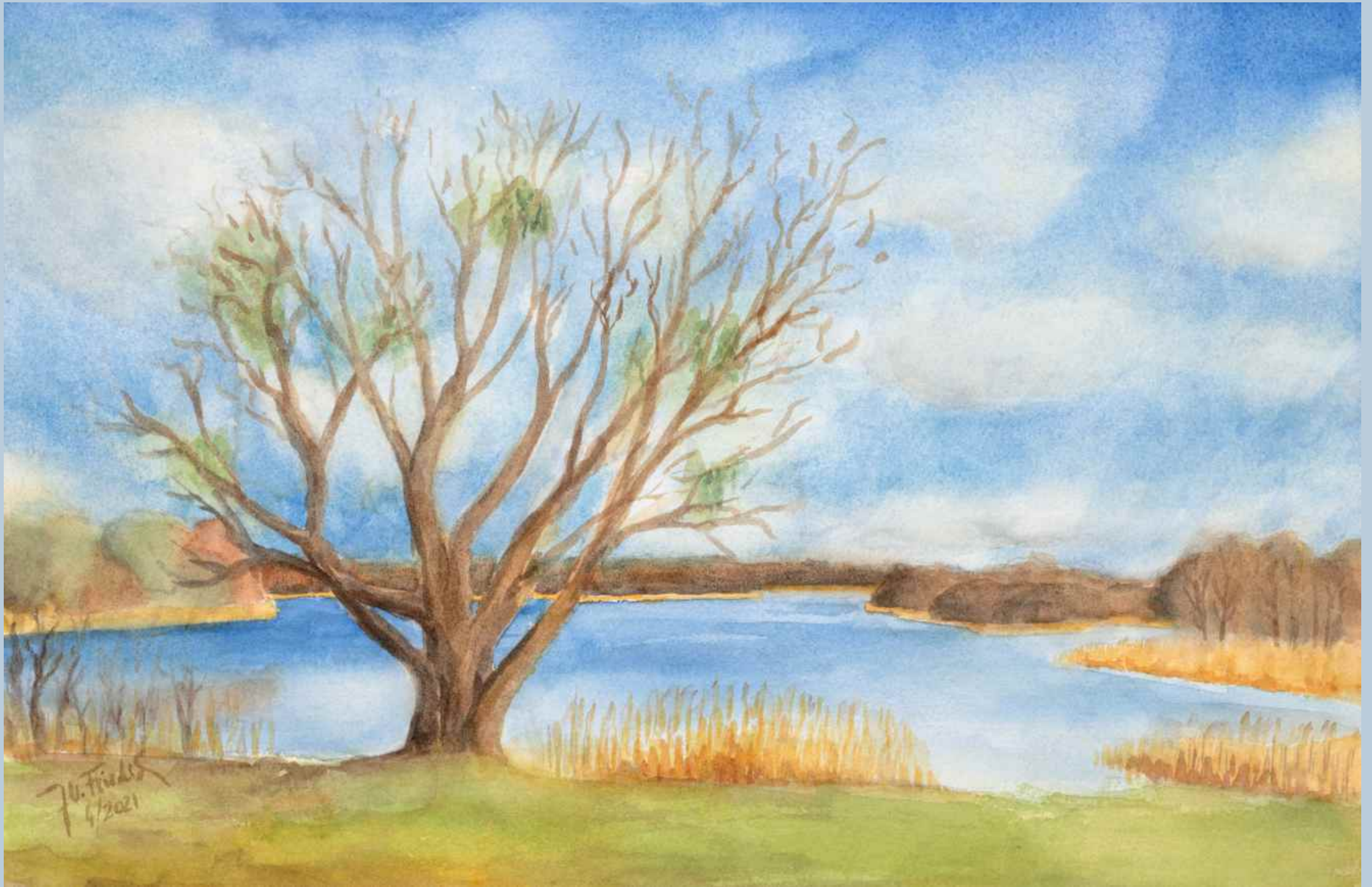
die Natur am Zaarsee erwacht langsam aus ihrem Winterschlaf