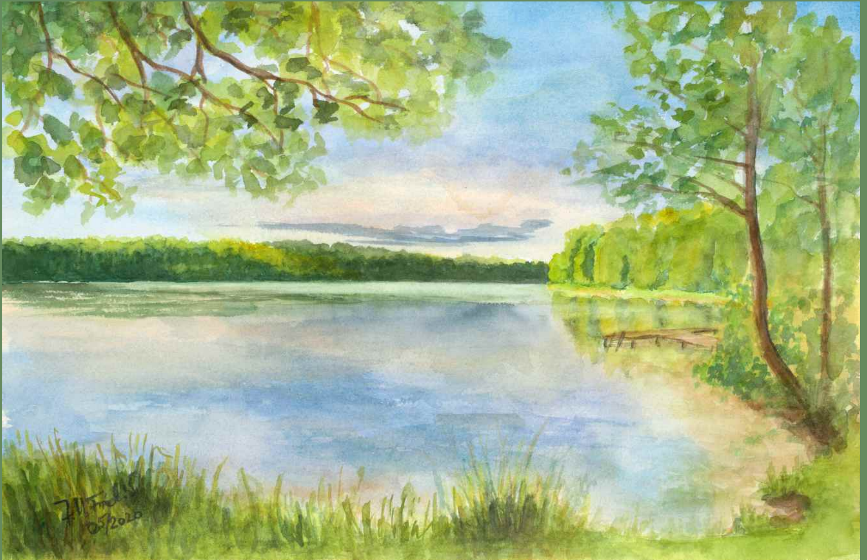
im Mai wird alles endlich wieder grün, wie hier am Zensee