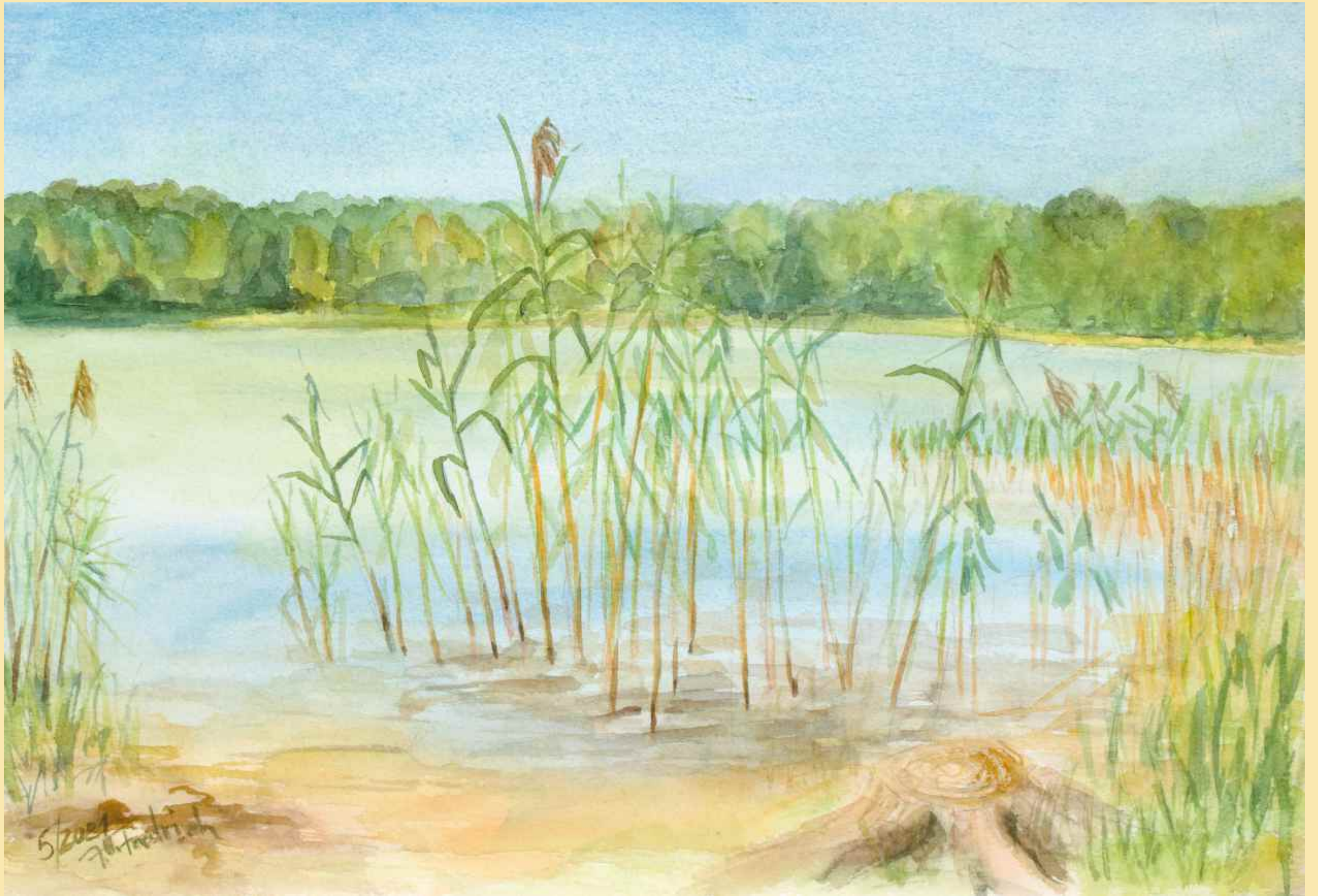
verträumte Stimmung am Glambecksee