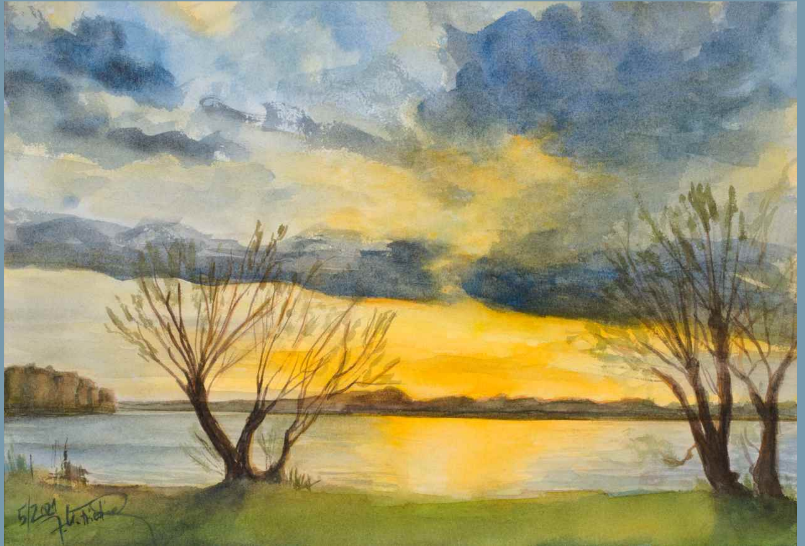
ein imposanter und weiter Abendhimmel über dem Röddelensee